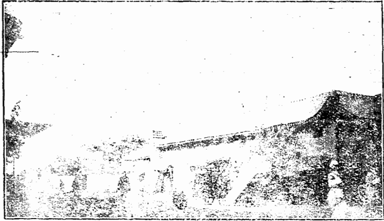
西 安 城 北 街 中 華 聖 公 會 之 禮 堂